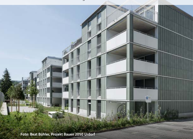
Projekt Bauen 2050 Urdorf

CO 2 -neutral; dank Hybridbox® keine Winterstromlücke